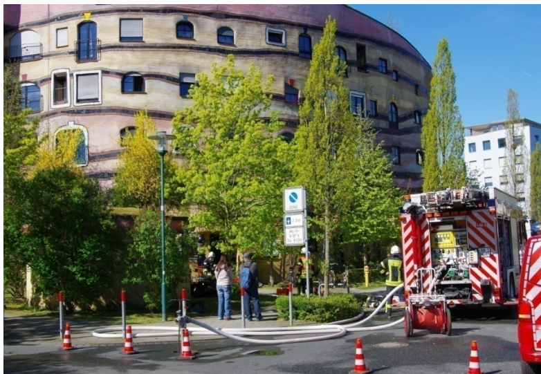
21.04.16 Hundertwasser-Haus Kellerbrand BF: ELW und Löschzug FF-DA Innenstadt Polizei, Rettungsdienst