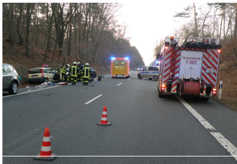
26.02.16 B3 bei Kaserne Verkehrsunfall BF: Hilfeleistungszug Polizei, NA, 2 RTW 2 verl. Personen