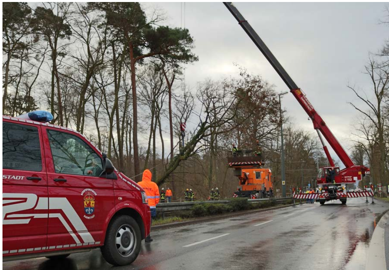
08.02.16 Heidelberger Straße Bäume auf Oberleitung BF: ZFW, HTLF, KW Polizei, HEAG-Netz