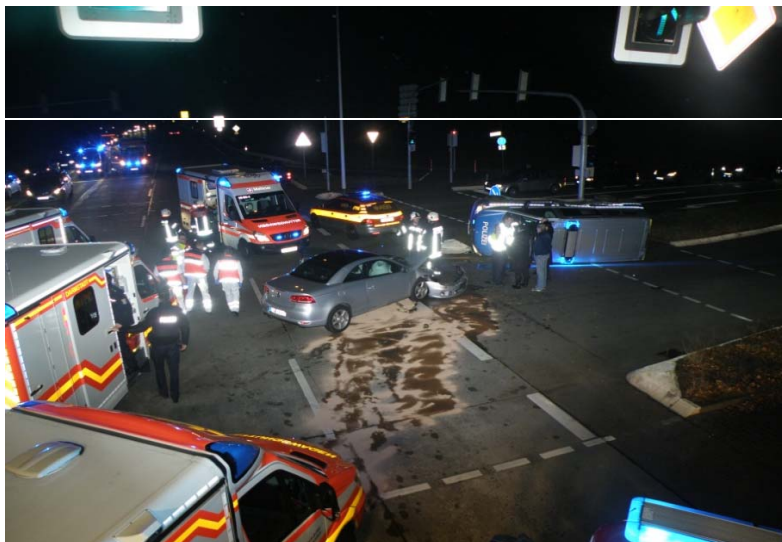
18.02.16 Kreuzung B3 / B426 Verkehrsunfall BF: Hilfeleistungszug Polizei, NA, LNA, 4 RTW 4 verl. Personen