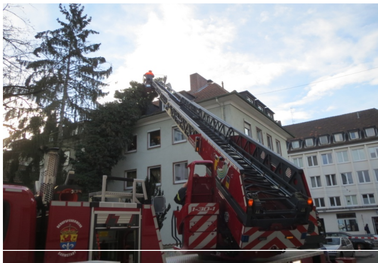
20.11.16 Kirchtanne Baum auf Haus BF: HLF und DL Polizei